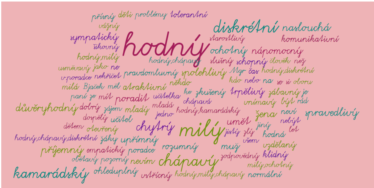
Obrázek 2. Požadavky na výkon výchovného poradce zobrazené metodou Word Cloud

Respondenti měli také možnost vyjádřit se k návrhům na zlepšení výchovného poradenství na dané škole. Nejčastěji se objevil návrh na zlepšení dostupnosti výchovného poradce pro žáky a zvýšení povědomí žáků o existenci tohoto pracovníka ve škole, dále potom změna výchovného poradce za „nepedagoga“ a zvýšení časové dotace na poradenství pro žáky. Další výsledky ukazuje následující graf.